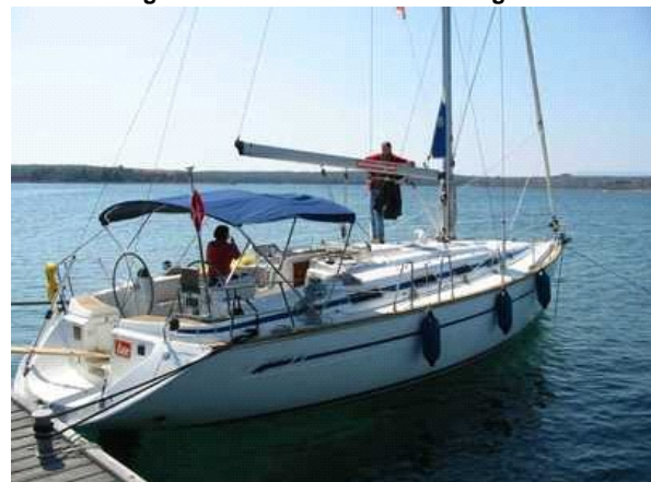
Ansicht Bavaria 44 Tryphosa

Restzahlung bis 4 Wochen vor Charterbeginn